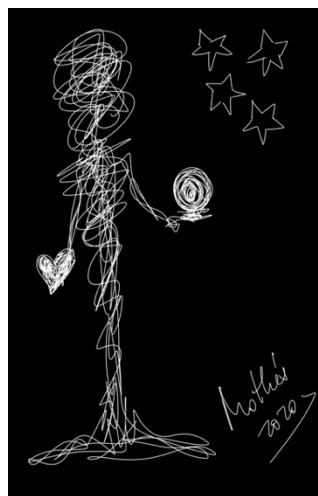
Garabato 9: Luz (Mothú 2020)