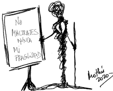
Garabato 5: No maltrates nunca mi fragilidad (Mothú 2020)

A veces somos nosotros los que no podemos hablar con la persona en duelo o tenemos miedo a hacerle daño y/o nos cuesta sostener su dolor. Cuando seas capaz de hablar con la persona, practica una escucha activa y empática , facilita su desahogo, dejándole expresar cómo se siente y las cosas que echa de menos de su familiar. Evita usar frases hechas , que lo único que hacen es minimizar el dolor.